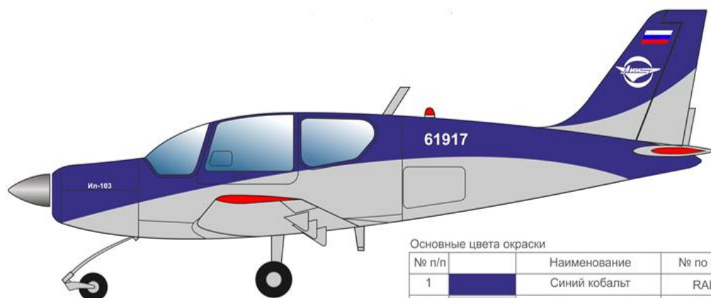
Основные цвета окраски